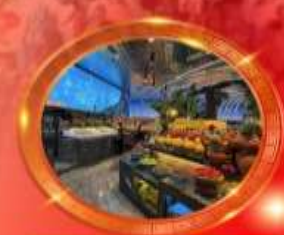
บุฟเฟต์หมีโพงซิ่ง