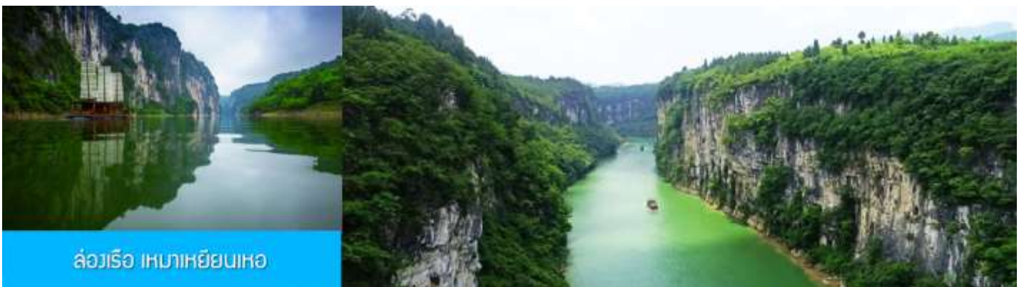
ล่องเรือ เหมาเหยียนเหอ