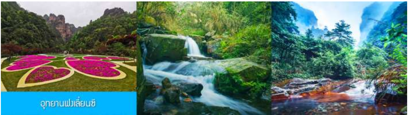
อุทยานฟงเลี่ยนซี