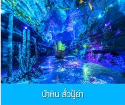
ปาหิน สั่วปู้ย่า

พักที่ YICHANG HUIHAO HOTEL โรงแรมระดับ 4 ดาวหรือเทียบเท่าในเมืองหิยซัง