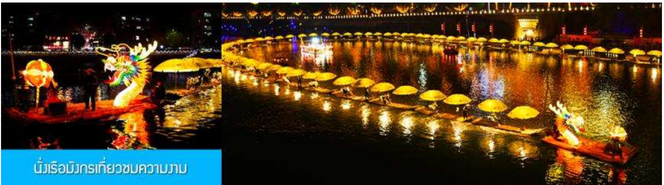
นั่งเรือมังกรเที่ยวชมความงาม

ไกด์นำเสนอโปรแกรมเสริม เป็นตัวนั่งเรือมังกรเที่ยวชมความงามของบ้านเรือนและสิ่งปลูกสร้างสองฝั่งแม่น้ำในช่วงที่สวยงามที่สุดของเมือง เซียนอัน ที่ประดับประดาด้วยแสงสี และได้ชื่อว่าเป็นวิวยามค่ำคืนที่สวยงามที่สุดในมณฑลหูเป่ย์ เช่นเดียวกับเมืองโบราณฟงหวงในมณฑลหูหนาน.....อัตราค่าบริการสำหรับโปรแกรมเสริมนั่งเรือมังกรชมวิวยามค่ำคืน ท่านละ 190 หยวน หรือ 950 บาท ระยะเวลาที่ใช้ในการเรือมังกร ประมาณ 45 นาที ค่าบริการรวม ค่าบัตรเข้าชม ค่ารถรับ ส่ง และค่านำเที่ยวของไกด์ท้องถิ่น