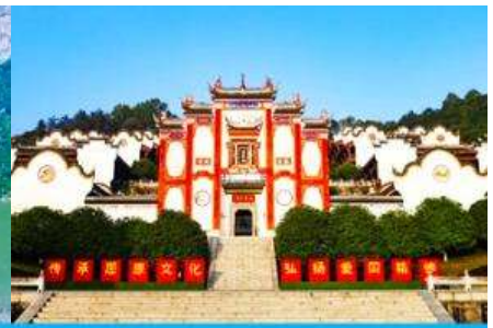
บ้านเกิดกวี ขวี่หยวน