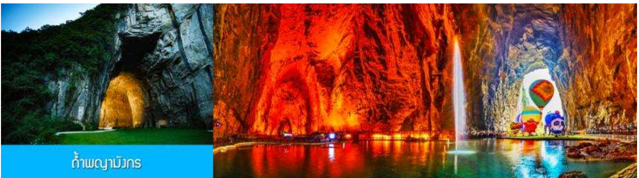
ถ้ำผญาบึงกร

ค่ำ อิสระอาหารมือค่ำ เพื่อความสะดวกในการเดินทางเที่ยวชมเมือง และลิ้มรสอาหารพื้นเมืองตามอัชฌาศัย พักที่ โรงแรม ENSHI SHENGHUA HOTEL ระดับ 4 ดาวท้องถิ่นหรือเทียบเท่าในเมืองเอนซือ