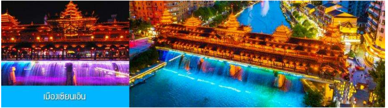
เมืองเซียนอัน

จากนั้นนำท่านสู่เมือง เซียนอัน 宣恩 เพื่อให้ท่านได้พบกับความสวยงามตระการตาของทัศนียภาพของแสงสีในยามค่ำคืนที่ได้ชื่อว่าสวยงามที่สุดในมณฑลหูเป่ย์