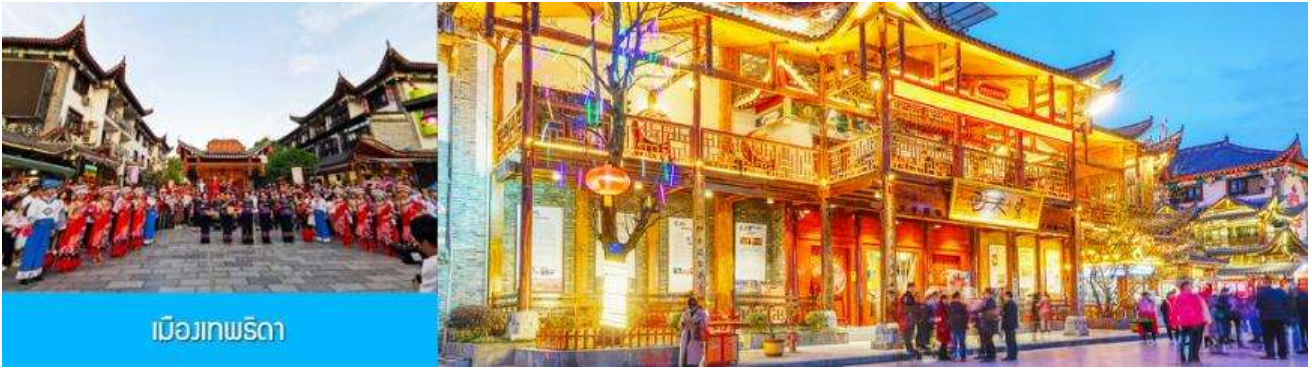
เมืองเทพริดา