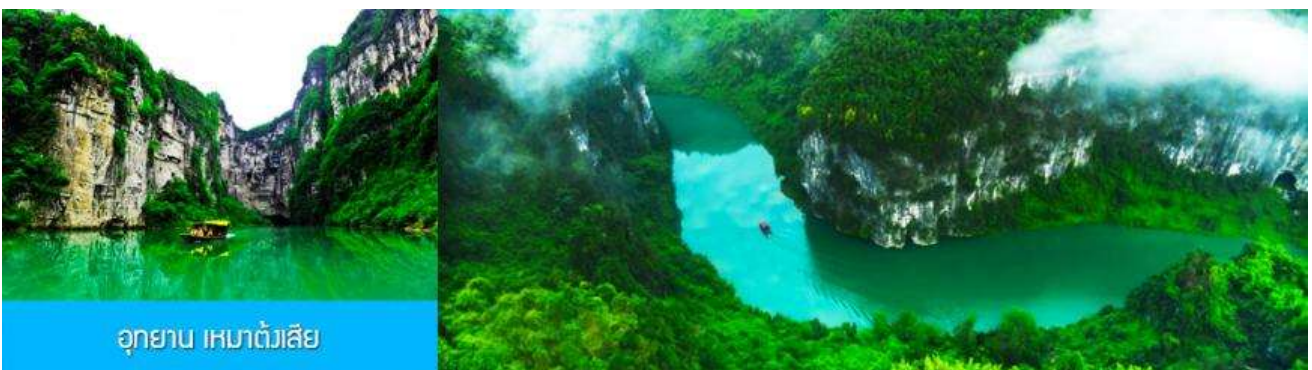
อุทยาน เหม่าต้งเสี

พักที่ โรงแรม VIENNA HOTEL ระดับ 4 ดาวท้องถิ่นหรือเทียบเท่าในเมืองเซียนอัน