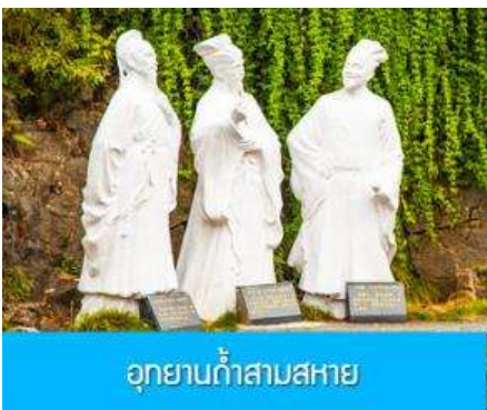
อุทยานถ้ำสามสหาย