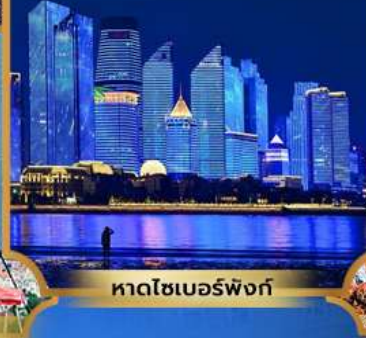
หาดโซเบอร์ฟังก์