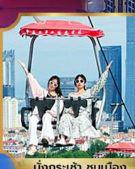
นั่งกระเช้า ชมเมือง