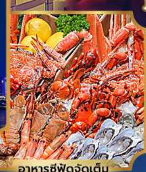
อาหารซีฟู้ดจัดเต็ม

บุฟเฟต์เบียร์ไม่อื่น + ซีฟู้ด + ปิ้งย่างเกาหลี