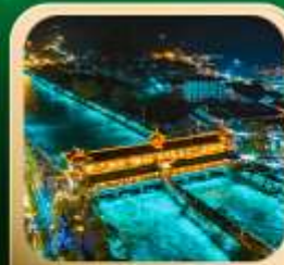
“สะพานหนานเฉียว น้ำตาสีฟ้า”