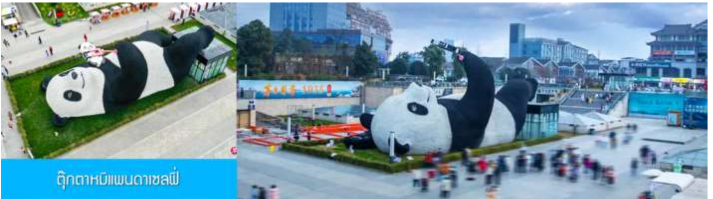
ตุ๊กตาหมีแพนด้าเซลฟี

เที่ยง รับประทานอาหารกลางวัน ณ ร้านอาหารพื้นเมือง (8)