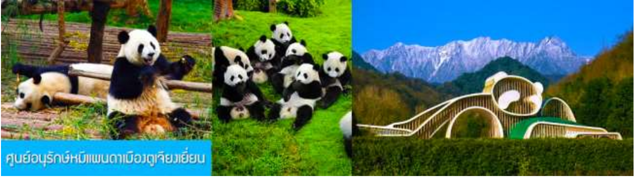
ศูนย์อนุรักษ์หมีแพนด้าเมืองตูเจียงเยียน

เช้า รับประทานอาหารเช้า ณ ห้องอาหารของโรงแรม (7) หลังอาหารเช้าท่านสามารถเลือกที่จะซื้อ โปรแกรมทัวร์เสริม หรืออิสระพักผ่อนตามอัธยาศัยใน โรงแรม