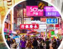
Shopping Taim Sha Tsui