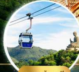
รวมกระเช้าฮ่องกง