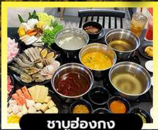
ซาบูฮ่องกง