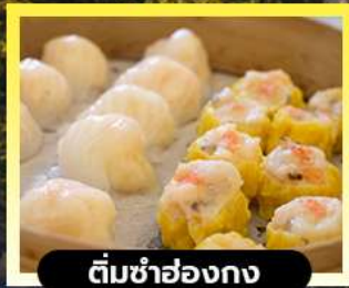
ตัมซ่าฮ่องกง