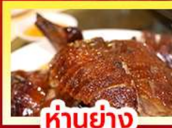
ห่านย่าง