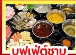
บุฟเฟ่ต์ซาบู