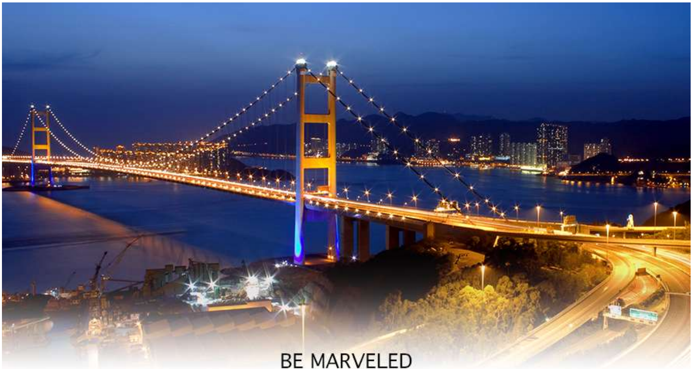
BE MARVELED สะพานแขวนฉิวหม่า