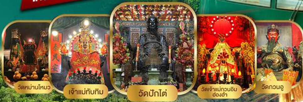
วัดบ้านโหนด