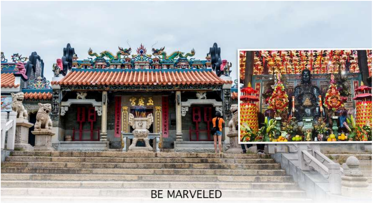
BE MARVELED วัดปักไต้