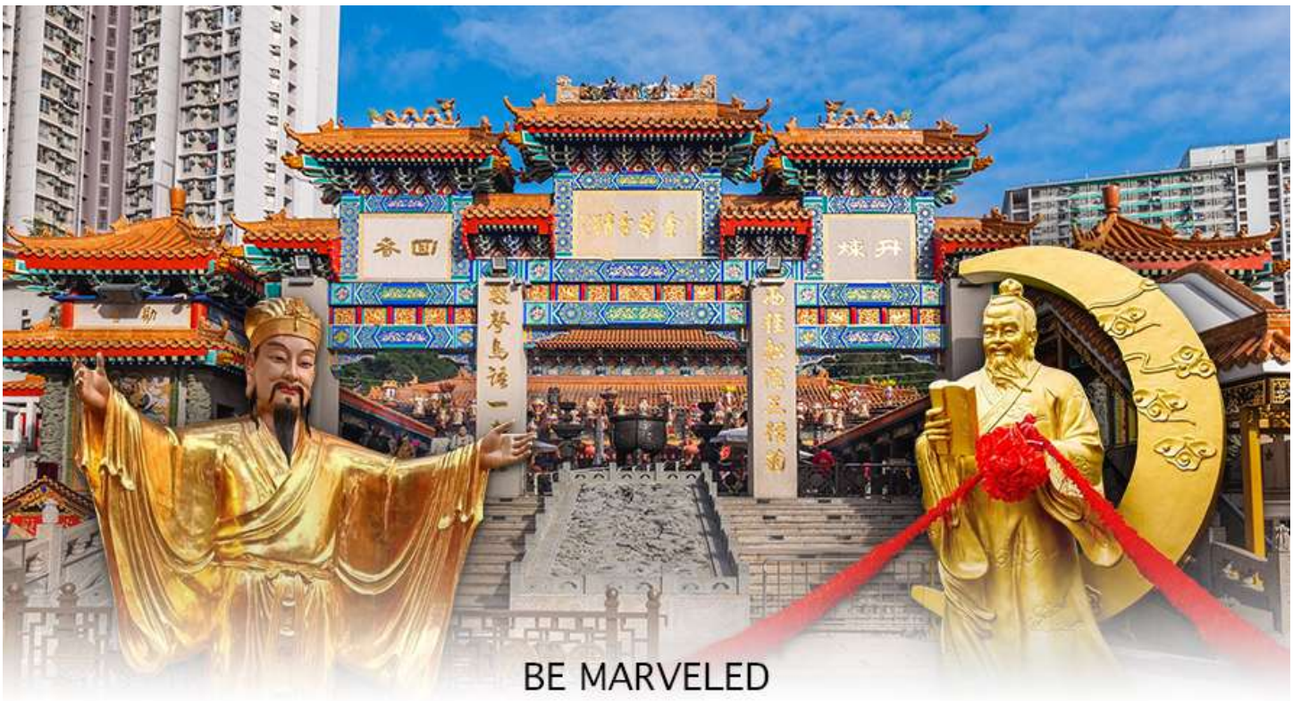
BE MARVELED วัดห้วงไต้เซียน

จะนิยมมาไหว้ขอพรในทุกๆ เรื่อง เพราะมีองค์พระมากมาย สาเหตุที่ทำให้ วัดห้วงไต้ซิน นั้น มีชื่อเสียงโด่งดังขึ้นมา ก็เพราะ พระหวังต้าเซียน หรือที่รู้จักกันในชื่อ ฮวงชูปิง (Huang Chu-ping) ในช่วงประมาณศตวรรษที่ 4 ได้เดินทางจากเมืองจินมาเผยแผ่ศาสนาในฮ่องกง และสร้างวัดแห่งนี้ขึ้นมาเมื่อประมาณปีค.ศ. 1921 ค่ะ ภายในวัดจะมีทั้ง เทพเจ้าหวังต้าเซียน, เจ้าแม่กวนอิม, เจ้าที่, เทพเจ้าหยุกโหลว (เทพเจ้าแห่งความรัก), ท่านขงจื้อ ซึ่งคนฮ่องกงเอง และนักท่องเที่ยวก็จะมากราบไหว้เพื่อสิริมงคลกัน โดยเฉพาะอย่างยิ่งคือ เทพเจ้าหยุกโหลว หรือ เทพเจ้าแห่งความรัก ที่เราเรียกกันว่า เทพเจ้าด้ายแดง เป็นพิภดที่หลายๆ คนมักจะไปขอความรักจากท่านกัน นอกจากนี้ที่เราจะต้องเอาด้ายแดงมาพันมือนี๊ ตามป้ายที่แนะนำข้างหน้าแล้ว ไกด์นำเที่ยวคนฮ่องกงบอกมาว่าถ้าเป็นผู้หญิงอย่างเราอยากได้แฟน ก็ต้องไปผูกด้ายที่รูปปั้นผู้ชายและพอไหว้เสร็จแล้วก็อย่าลืมหยอดทำบุญใส่ตู้ไปด้วย