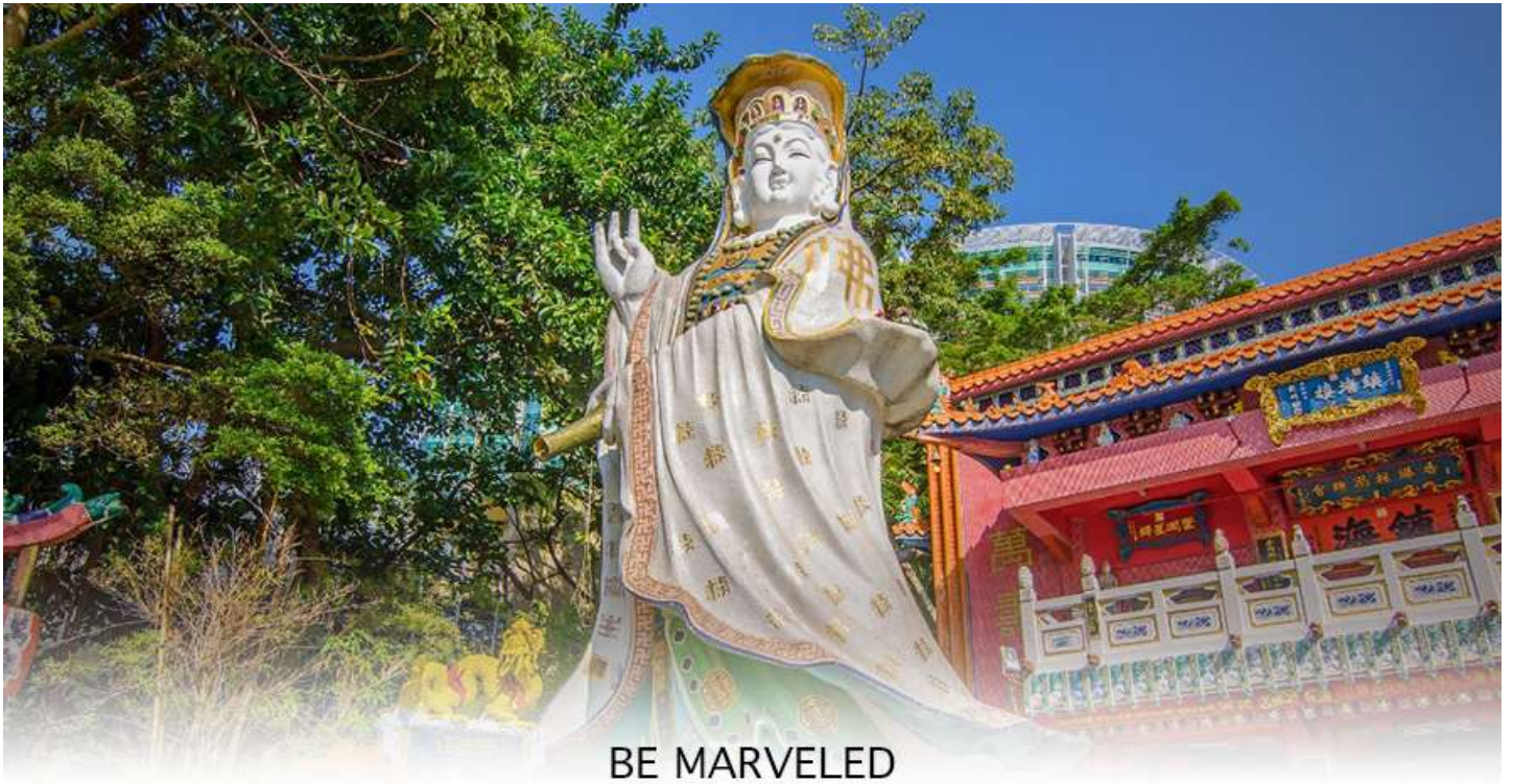
BE MARVELED วัดเจ้าแม่กวนอิมริพลัสเบีย