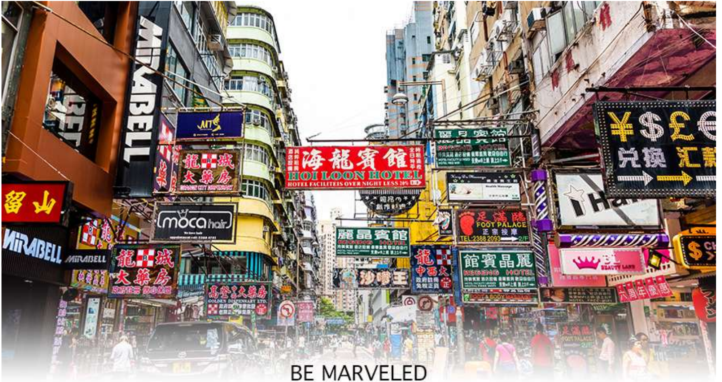
BE MARVELED MONGKOK

จากนั้นนำท่านช้อปปิ้ง ย่านมังก็อก (MONG KOK) เป็นแหล่งช้อปปิ้งที่เต็มไปด้วยตรอกซอกซอยที่มีเอกลักษณ์แปลกตา รวมทั้งตลาดเก่าแก่ที่สะท้อนเสน่ห์และวิถีชีวิตของคนท้องถิ่น ถือเป็นหนึ่งย่านยอดนิยมที่นักท่องเที่ยวทุกคนต้องแวะเวียนมา ภายในย่านมีตลาดนัด LADIES' MARKET ขนาดใหญ่ซึ่งมีร้านขายเสื้อผ้า เครื่องสำอาง รองเท้า กระเป๋า เครื่องประดับมากมาย อีกทั้งยังมีร้านอาหาร และเครื่องดื่ม ที่ขึ้นชื่อหลากหลายชนิด ให้ทุกท่านได้ลองลิ้มรสอีกมากมาย