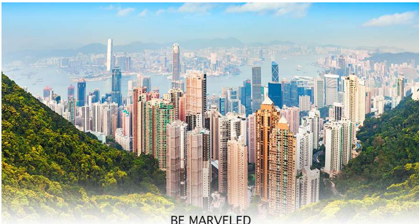
BE MARVELED Victoria Peak