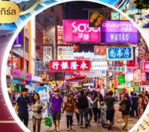
Shopping Tsim Sha Tsui