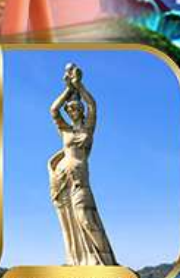
จูไห่ฟิชเชอร์เกิร์ลา