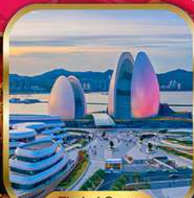
Zhaihai Opera House