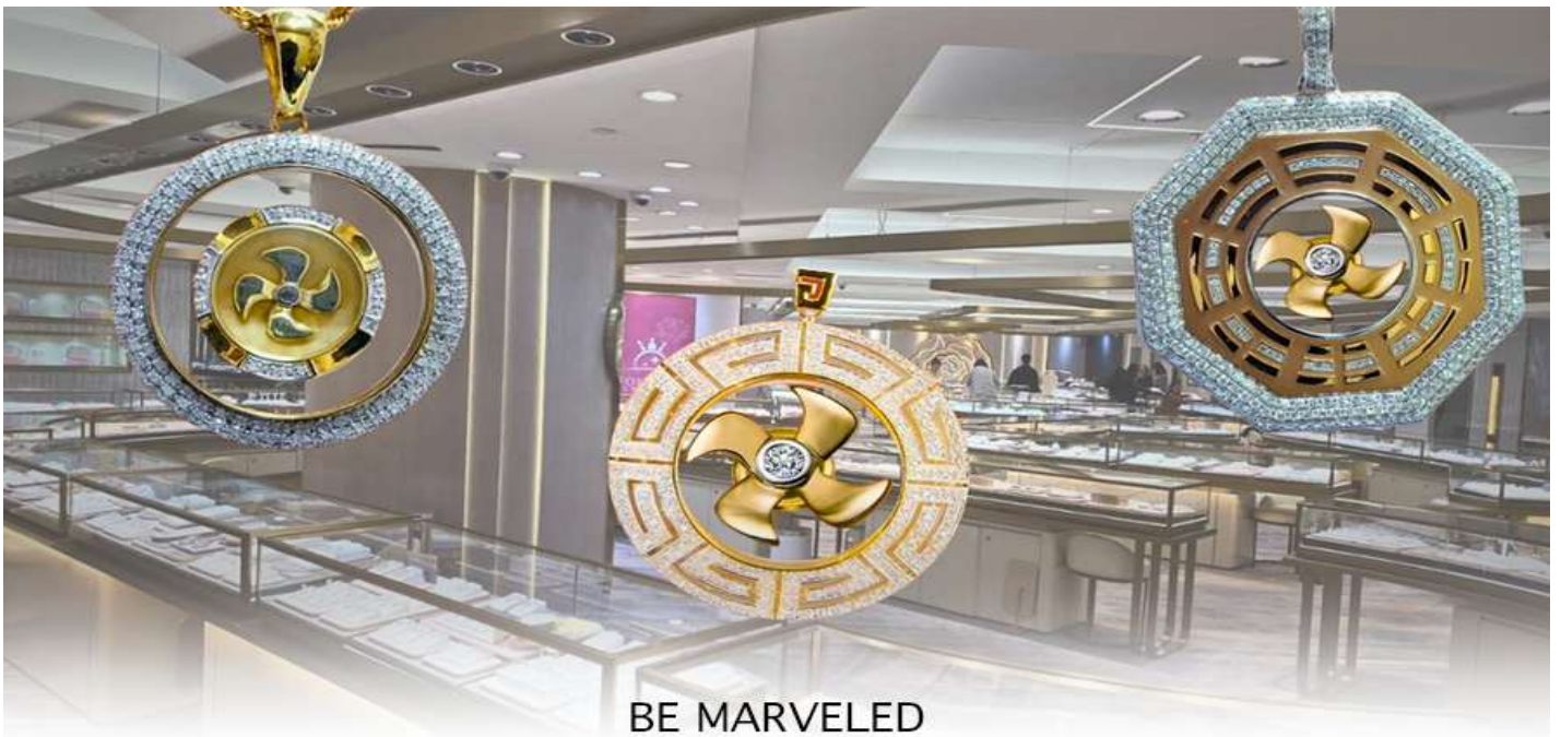
BE MARVELED ศูนย์ฮวงจุ้ย กัททันเศรษฐี

นำท่านชม ศูนย์ฮวงจุ้ย กัททันเศรษฐี ที่ขึ้นชื่อของฮ่องกง ท่านจะได้พบกับงานดีไซน์ที่ได้รับรางวัลยอดเยี่ยม และใช้ในการเสริมดวงเรื่องฮวงจุ้ย โดยการย่อใบพัดของกังหันที่เป็นสัญลักษณ์ของวัดวัดเซ่งหิมิว มาทำเป็นเครื่องประดับ ไม่ว่าจะเป็นจี้, แหวน, กำไล หรือต่างหูเพื่อเป็นเครื่องประดับติดตัว และเสริมดวงชะตา ซึ่งสินค้าทุกชนิด มีเอกสาร รับประกันคุณภาพเปลี่ยนหรือซ่อม ได้ตลอดอายุการใช้งาน หากเกิดการชำรุดจากสินค้าไม่ใช่อุบัติเหตุ