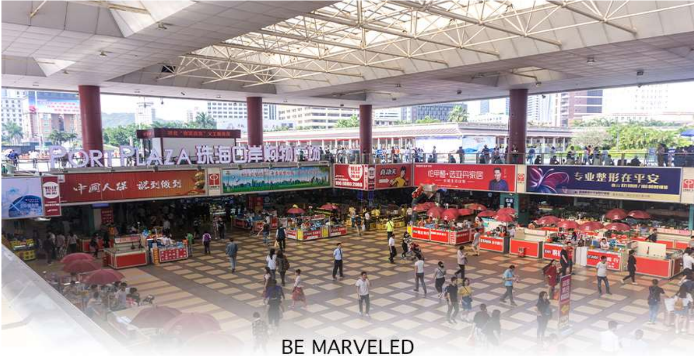
BE MARVELED ตลาดใต้ดิน กวเป่ย์

📍 อิสระอาหารอาหารเย็นตามอัธยาศัย **เพื่อความสะดวกในการช้อปปิ้ง**