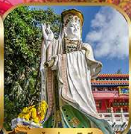
เจ้าแม่กวนอิม พลัสเบย์