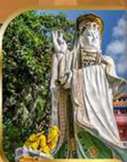
เจ้าแม่กวนอิม ริวฮัสนยี่