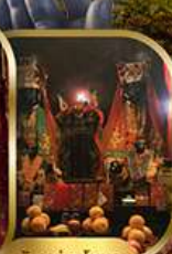
วัดบ้านโหนด