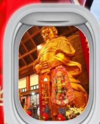
วัดฯชงหมิว