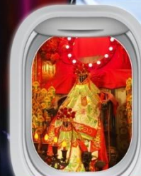
เจ้าแม่กวนอิมฮองฮ่า