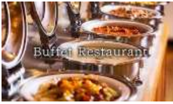
อาหารเย็น : อาหาร บุฟเฟต์ สไตส์ญี่ปุ่น