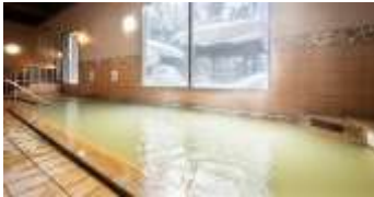
หลังอาหารค่ำ ให้ทุกท่านผ่อนคลายกับการแช่น้ำแร่ธรรมชาติสไตส์ญี่ปุ่น