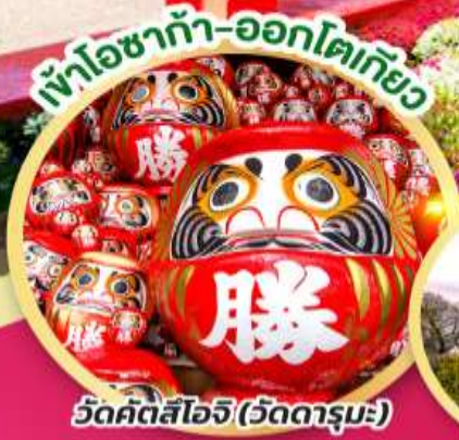
เข้าโซาก้า-ออกโตเกียว