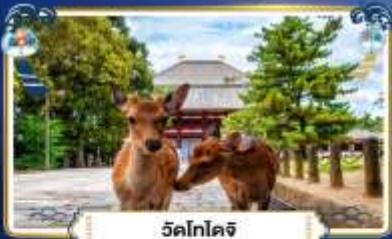
วัดโทไดจิ