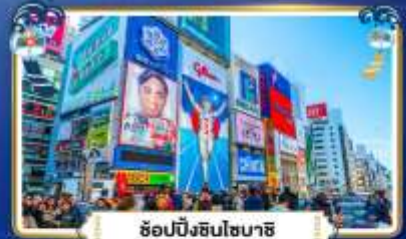
ฮอปบิงชินโซบาสึ