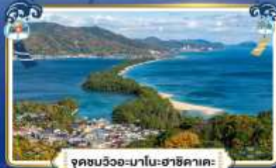
จุดชมวิวกะมาโนะฮาชิคาตะ