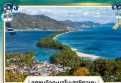
จุดชมวิວอะมาโนะฮาซิดาเตะ