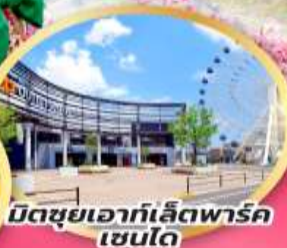
มิตซูเอากะเลียตพาร์ค เซนได

จุดชมซากุระเริ่มต้น ฮิโตะเมะ เซ็มบง ซากุระ