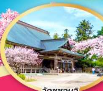
วัดชูซอนจิ