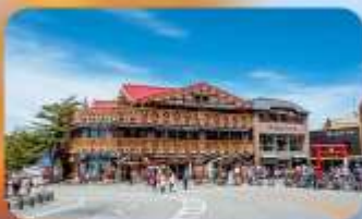
ภูเขาไฟฟูจิ ชั้นที่ 5