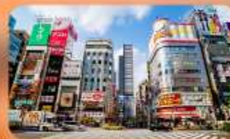
ซ้อปิ้งชินจูกุ