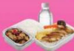
บริการอาหารร้อนบนเครื่อง ซาโป - ซากสับ