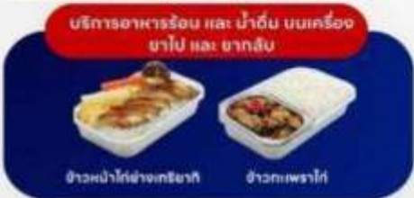
บริการอาหารร้อน และ น้ำดื่ม บนเครื่อง ขาไป และ ขากลับ