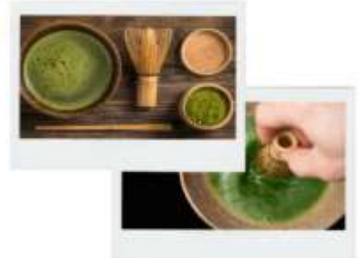
รูปภาพไฮไลท์ประกอบการโฆษณาเท่านั้น