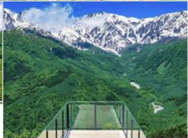
HAKUBA MOUNTAIN HARBOR THE CITY BAKERY