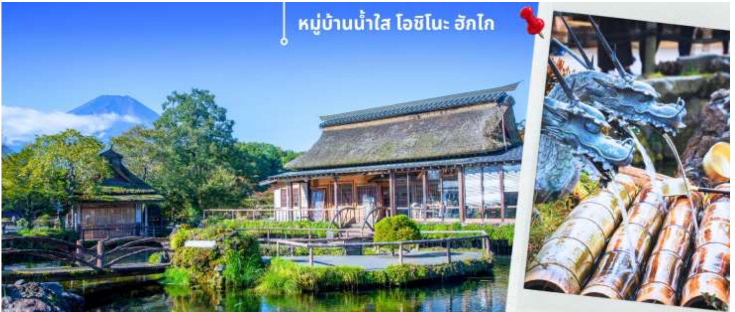
หมู่บ้านน้ำใส ไอชิโนะ อักโก

นำท่านแวะชม พิพิธภัณฑ์แผ่นดินไหว เป็นพิพิธภัณฑ์ที่แสดงถึงผลกระทบจากภัยพิบัติแผ่นดินไหวและการระเบิดของภูเขาไฟ ภายในพิพิธภัณฑ์มีห้องจัดแสดงข้อมูลการประทุของภูเขาไฟจากทุกมุมโลก โชนความรู้ต่างๆและโชนซ์อปปิ้งสินค้าญี่ปุ่น อาทิเช่น ผลิตภัณฑ์เครื่องสำอางและของฝากอีกมากมาย