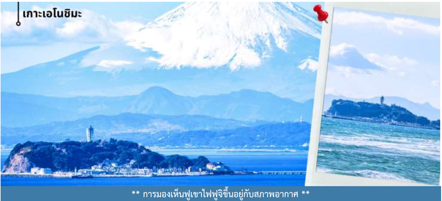
เกาะเอโนะชิมะ

หลังรับประทานอาหารเที่ยง นำท่านเดินทางสู่ เกาะเอโนะชิมะ ผ่านสะพานเอโนะชิมะ เบนเท็น ซึ่งเป็นเส้นทางเชื่อมระหว่างแผ่นดินใหญ่กับตัวเกาะ ระหว่างทางสามารถชมบรรยากาศของท้องทะเลและวิวชายฝั่งได้อย่างเพลิดเพลิน และในวันที่อากาศแจ่มใสยังสามารถมองเห็นภูเขาไฟฟูจิได้จากกระยะไกลอีกด้วย