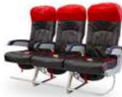
ที่นั่ง Hot Seat

ที่นั่งสุดพิเศษขนาดที่นั่งกว้าง 19 นิ้ว ที่มีความสะดวกสบายขนาด 59 นิ้ว และสามารถปรับเอนนอนได้มากกว่า 45 องศา พร้อมด้วยอุปกรณ์อื่นๆ ที่ให้ท่านเดินทางอย่างสะดวกสบายบนเครื่องบินแอร์ไลน์พรีเมียม บริการดีเลิศที่ห้องพรีเมียมพลอเนอในเที่ยวบินของแอร์เอเชีย