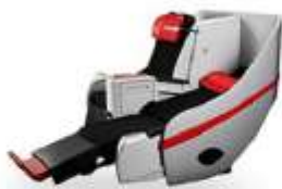
ที่นั่งพรีเมียมพลอเนอ

■ ที่นั่งพรีเมียมพลอเนอ ■ ที่นั่ง Hot Seat ที่นั่งมาตรฐาน ไลบรารีดีสค เบาะกลุ่มคน — ที่นั่งทารก ● ลิ้นชัก