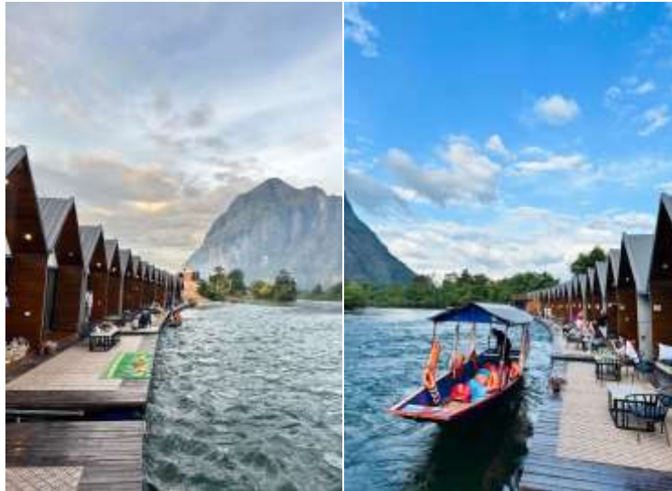
แพที่ แพรียวไรซ์ 2 หรือเทียบเท่า

อิสระให้ท่านพักผ่อนชมธรรมชาติตามอัธยาศัย