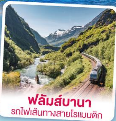
ฟลัมส์บานา รถไฟเส้นทางสายโรแมนติก