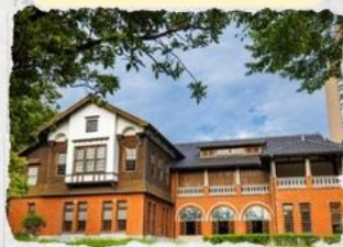
พิพิธภัณฑชาาน้ำพุร้อน