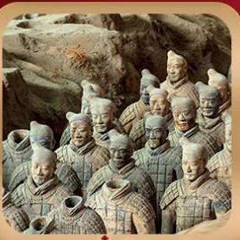
“สุสานจีนซีฮ่องเต้”

ชมถ้ำหลงเหมิน มรดกโลกที่เมืองลั่วหยาง • สุสานจีนซีฮ่องเต้ • ศาลเจ้ากวนอู วัดเส้าหลิน + ป่าเจดีย์ + ชมโชว์กังฟู • เมืองโบราณลั่วหยาง • อุทยานหยุนไท่ซาน เจดีย์ห่านป่าใหญ่ • ถนนวัฒนธรรมต้ากิง • ถนนคนเดินอิสลาม • จัตุรัสหออระขิง