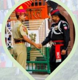
พิธีลดธงพระแดน อินเดีย-ปากีสถาน ชายแดนวากา (Wagah border)