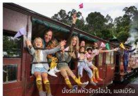
นั่งรถไฟหัวจักรไอน้ำ, เมลเบิร์น