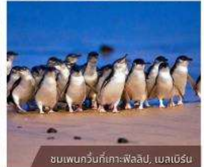
ชมเพนกวินที่เกาะฟิลลิป, เมลเบิร์น