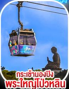
กระเช้าเองปีงพระใหญ่โป่วหลิน