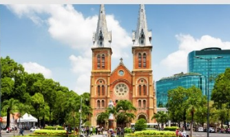
โบสถ์นอร์ทเทรอดาม