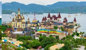
สวนสนุกวันเดอร์ส

*ทางบริษัทฯ ขอสงวนสิทธิ์ในการสลับโปรแกรมทัวร์ตามความเหมาะสมขึ้นอยู่กับสถานการณ์หน้างาน โดยคำนึงถึงผลประโยชน์ของลูกค้าเป็นสำคัญ