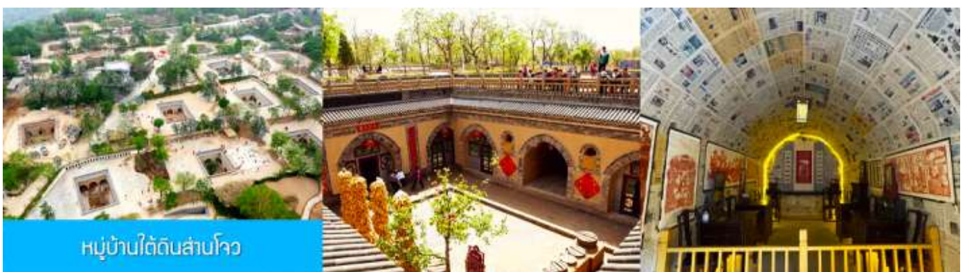
หมู่บ้านใต้ดินสามโจว

หลังอาหารนำท่านเดินทางสู่ เมืองซานเหมินเกีย 三门峡 (ระยะทาง 149 กม ใช้เวลาเดินทางราว 2 ชั่วโมง)