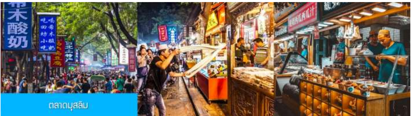
ตลาดบุนสลิบ