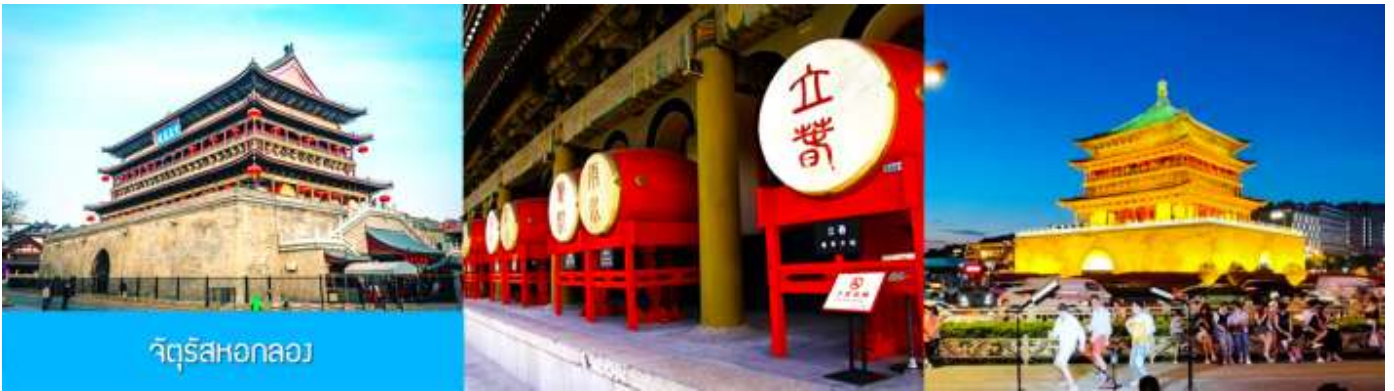
จัตุรัสหอกลอง