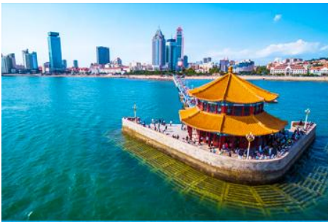
สะพานเจี้ยนเจียว