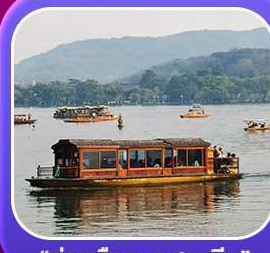
“ล่องเรือทะเลสาบซีหู”

หุบเขาเทวดาวังเซียนกู่ หมู่บ้านที่ตั้งอยู่ริมหน้าผา • หมู่บ้านโบราณหวงหลิง ป่าสนน้ำชิงซาน • ล่องเรือทะเลสาบซีหู • ถนนโบราณตุ๋นโจ้ว • ชมแสงสีที่ ฉู่หนีโจ้ว