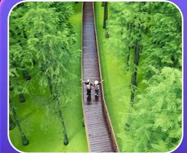
“ป่าสนชิงซาน”