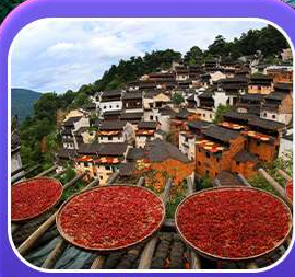
“หมู่บ้านหวงหลิง”

หังโจว ฉู่โจว ช่างเหรา ฉู่หยวน หุบเขาเทวดา