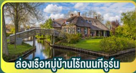
ล่องเรือหมู่บ้านไรน์บนทีกูร์น