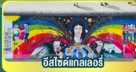
อีสไซด์แกลลอรี่