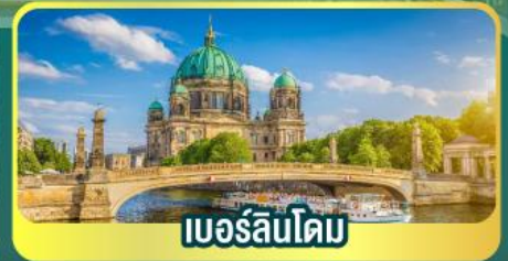
เบอร์ลินโดม