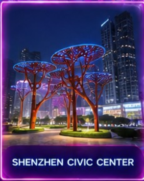
SHENZHEN CIVIC CENTER