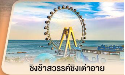
ซิงซ่าสวรรค์ซิงต้าอาย