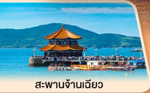
สะพานจันเฉียว