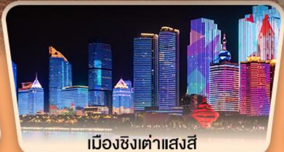
เมืองซิงต้าแสงสี