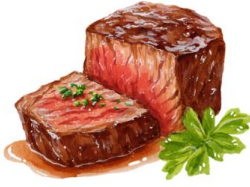
● เนื้อวัว

ขอความกรุณาแจ้งวัตถุดิบที่ท่านแพ้หรือไม่สามารถรับประทานได้