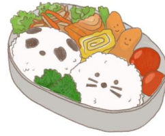
● อาหารสำหรับเด็ก ( 2-11 ปี ) *วัตถุดิบขึ้นอยู่กับทาว์ราน