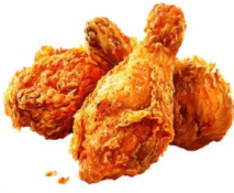
● เนื้อสัตว์ปีก (ไก่)