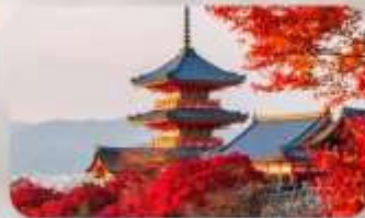
วัดคิโยมิชิ