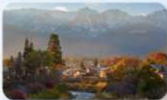
โออิเตะ ปาร์ค