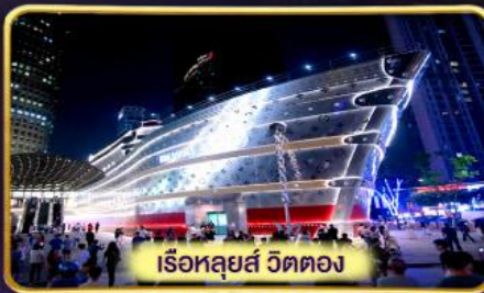
เรือหลุยส์ วัดตอง