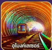
อุโมงค์เตาเซอ์