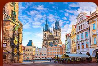
ชมย่านเมืองเก่า ปราก