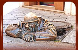
แลนด์มาร์คคัง รูปปั้นคูมิล ปรากติสลาวา