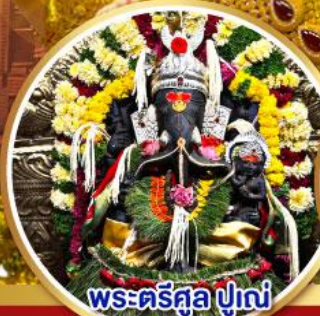
พระศรีศูล ปูणे (Trishul Pune)